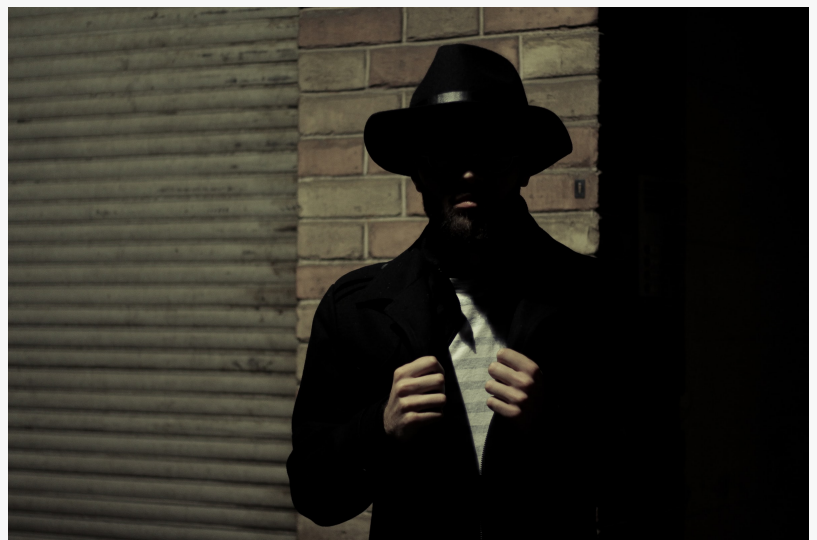
AV-Comparatives - Schutz Stalkerware

Peter Stelzahmmer AV-Comparatives 4372011720 media@av-comparatives.org Visit us on social media: Facebook Twitter LinkedIn